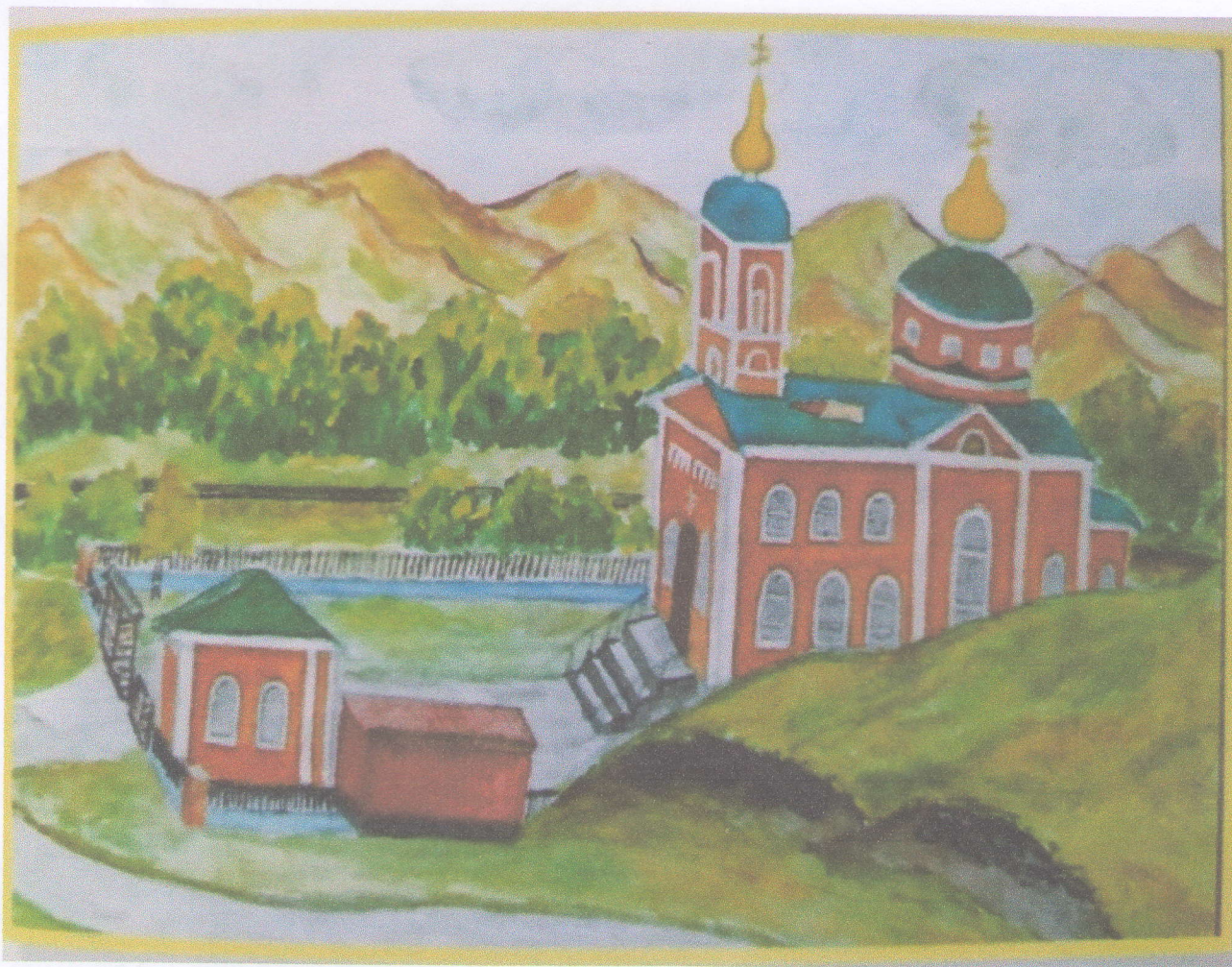
Храм святого Николая Чудотворца

РАЗРАБОТАЛА: Л.А. Савкина Богословская иконописная категория МДОУ «Детский сад №6 «Золотой ключик»