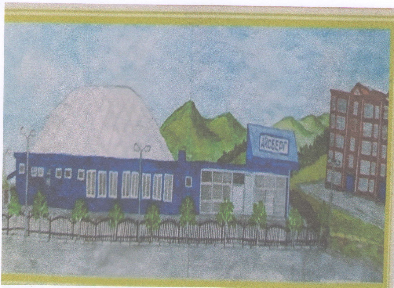
Ледовый дворец «Айсберг»